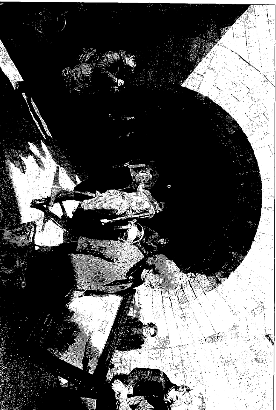
Les exposants ont démenagé leur stand sous le regard, parfois intrigué, des visiteurs.

Heureusement, la grande majorité des vingt exposants s'adapte avec bonne humeur et va s'installer à l'extérieur, devant le fort. Même flârt-play